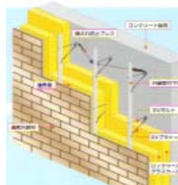
EV外断熱工法・外壁の構成